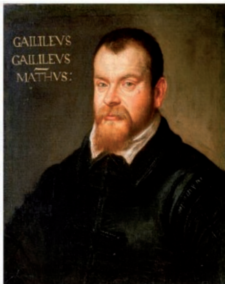
Domenico Tintoretto, Galileo Galilei , 1605-07, National Maritime Museum, Londra.

«Galileo e Chiesa, processi finiti? Nonostante papa Wojtyła nel 1992 abbia 'riabilitato' Galileo Galilei (1564-1642), riconoscendo che la sua condanna fu il frutto di una 'tragica incomprensione reciproca tra lo scienziato pisano e i giudici dell'Inquisizione', il 'tormentato' caso Galileo, ad oggi non sembra ancora del tutto chiuso. Sulla vicenda manca ancora un giudizio storico globale, obiettivo e sereno che trascenda gli ostacoli psicologici e emotivi, nonché la sterile polemica della contrapposizione laici/cattolici».