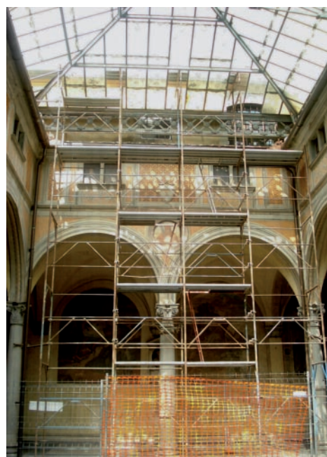
I restauri della Cappella di S. Girolamo e la vetrata del Chiostro dei Voti.