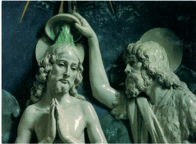
Andrea della Robbia (attr.), Battesimo di Gesù , seconda metà sec. XV, Santa Fiora (Gr), Chiesa parrocchiale.

liberato, e la liberazione è definitiva: lo Spirito non scende solo su Cristo, ma rimane su di lui. Lo Spirito che dopo il peccato non aveva più dimora permanente fra gli uomini (Gen 6,3) ora rimane per sempre in Cristo e nella Chiesa che ne è compimento.