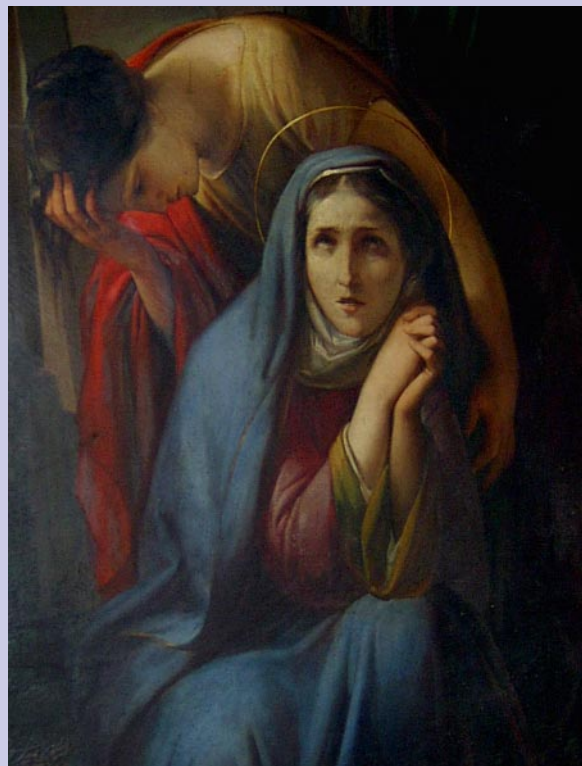
Ferdinando Folchi, Maria Addolorata , part. dalla Deposizione , 1855, già nella Cappella del Crocifisso della SS. Annunziata di Firenze, ora in restauro.

« ... poiché da te è nato il sole di giustizia, Cristo, nostro Dio; egli ha tolto la maledizione e ha portato la benedizione; ha vinto la morte e ci ha donato la vita ».