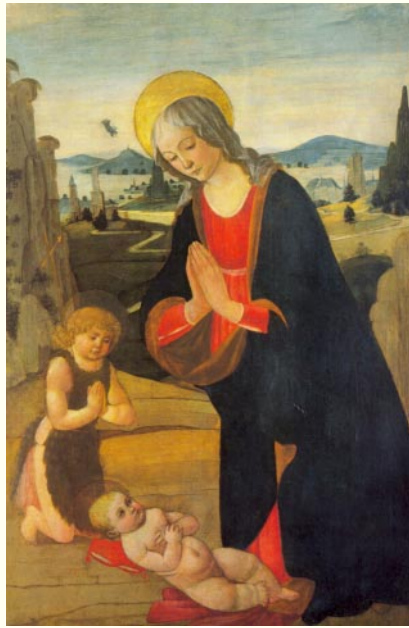
Gherardo di Giovanni, Madonna adorante il Bambino , 1475-80 c., Accademia, Firenze.

ghiere, renderle più vigili e gioiose. Abbandoniamo le nostre preghiere, così spesso annoiate, stanche, abitudinarie. La preghiera è la vitalità più genuina e profonda del cristiano: quando preghiamo, ricordiamoci di Colei che è Madre di Dio e Madre nostra. Ella è creatura orante per eccellenza. Nel suo Magnificat , non solo prega, ma esulta e canta come Vergine figlia di Dio che esprime i migliori sentimenti dell'Antico e Nuovo Testamento.