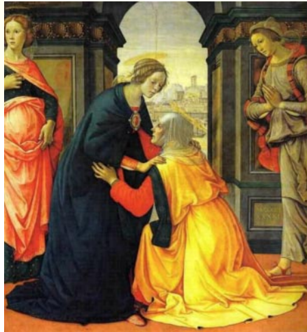
Domenico Ghirlandaio, La Visitazione , 1491, Museo del Louvre, Parigi.

È questo che vuol dire Maria nel suo Magnificat : Dio ha mostrato la potenza del suo braccio e ha rovesciato i potenti dai troni, ricordandosi della sua misericordia . E quelle altre sue parole: Tutte le generazioni mi chiameranno beata non sono presunzione ma profezia, che si è avverata